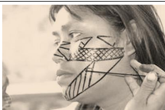
Figura 2 – Pintura indígena

http://doeruditoapopularasinopsedaza.blogspot.com.br/2012/06/artesanato-viva-o-ceara-correio.html