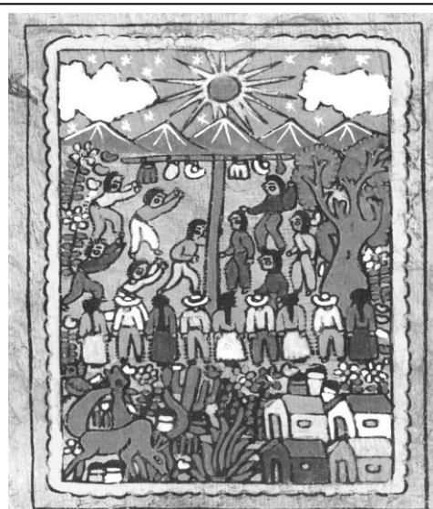
Figura 3 – Amate Mexicano