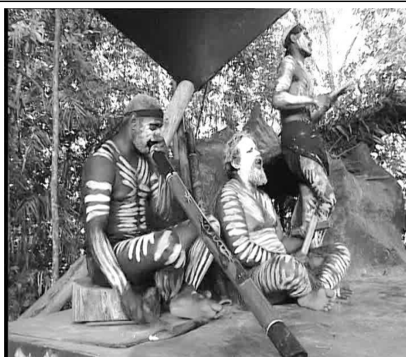
Figura 4 – Pintura aborígene australiana

https://br.pinterest.com/pin/171770173271583723/